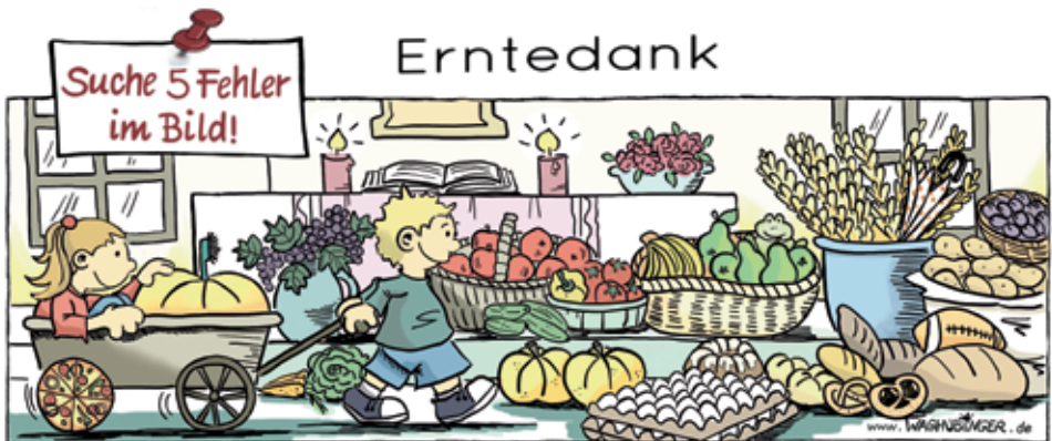
Pizza, Zahnbürste, Frosch, Regenschirm, Fußball

Abendmahl: W,T/E = Wein/Traubensaft im Einzelkelch, Hostien grundsätzlich glutenfrei